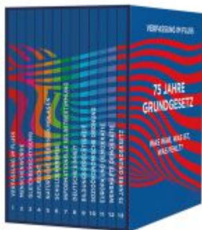
Verfassung im Fluss Ladenpreis: 18,50EUR

Wir haben andere Produkte gefunden, die Ihnen gefallen könnten!