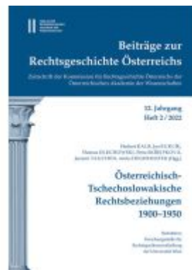
Beiträge zur Rechtsgeschichte Österreichs, 12. Jahrgang, Heft 2/2022 Ladenpreis: 49,00EUR