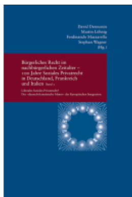
Bürgerliches Recht im nachbürgerlichen Zeitalter - 100 Jahre Soziales Privatrecht in Deutschland, Frankreich und Italien Ladenpreis: 91,50EUR