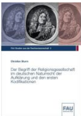
Der Begriff der Religionsgesellschaft im deutschen Naturrecht der Aufklärung und den ersten Kodifikationen Ladenpreis: 22,10EUR