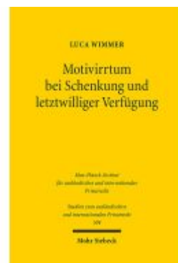
Motivirrtum bei Schenkung und letztwilliger Verfügung Ladenpreis: 76,10EUR