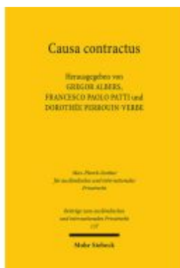
Causa contractus Ladenpreis: 142,90EUR