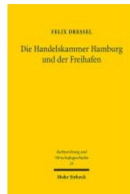
Die Handelskammer Hamburg und der Freihafen Ladenpreis: 76,10EUR