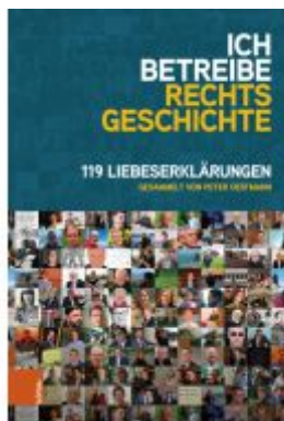
Ich betreibe Rechtsgeschichte Ladenpreis: 26,00EUR