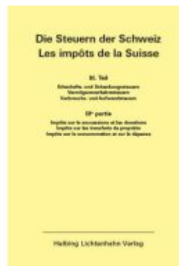
Die Steuern der Schweiz: Teil III EL 145 Ladenpreis: 97,00EUR