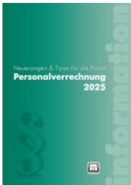
Personalverrechnung 2025 Ladenpreis: 48,00EUR

Wir haben andere Produkte gefunden, die Ihnen gefallen könnten!