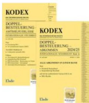
KODEX Doppelbesteuerung 2024/25 Ladenpreis: 73,00EUR