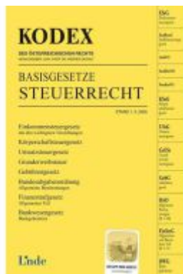
KODEX Basisgesetze Steuerrecht Ladenpreis: 17,00EUR