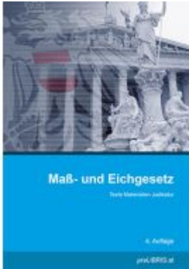
Maß- und Eichgesetz Ladenpreis: 33,00EUR