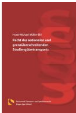
Recht des nationalen und grenzüberschreitenden Straßengütertransports Ladenpreis: 40,10EUR