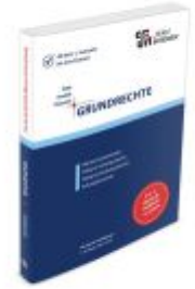
Grundrechte Ladenpreis: 32,80EUR