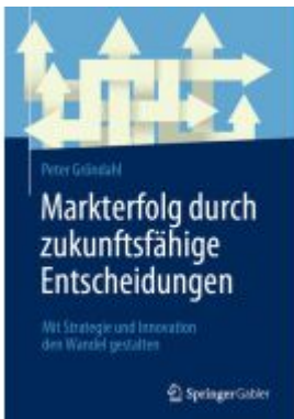
Markterfolg durch zukunftsfähige Entscheidungen Ladenpreis: 41,11EUR

Wir haben andere Produkte gefunden, die Ihnen gefallen könnten!