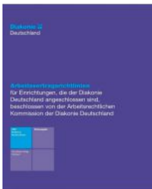
AVR der Diakonie Deutschland - Textausgabe Ladenpreis: 45,30EUR