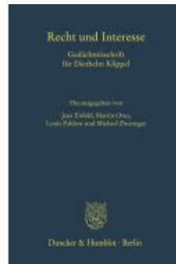
Recht und Interesse Ladenpreis: 154,10EUR