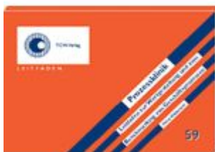
Prozessklinik Ladenpreis: 257,10EUR