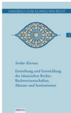
Handbuch zum islamischen Recht Bd. I. Ladenpreis: 23,50EUR