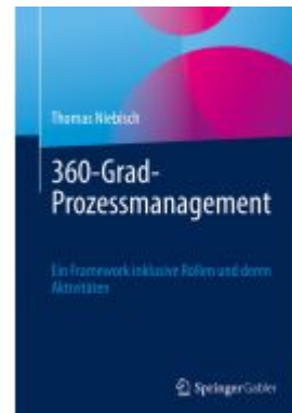
360-Grad-Prozessmanagement Ladenpreis: 56,53EUR