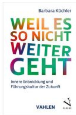
Weil es so nicht weitergeht Ladenpreis: 35,90EUR