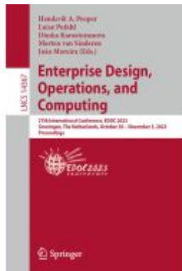
Enterprise Design, Operations, and Computing Ladenpreis: 63,79EUR