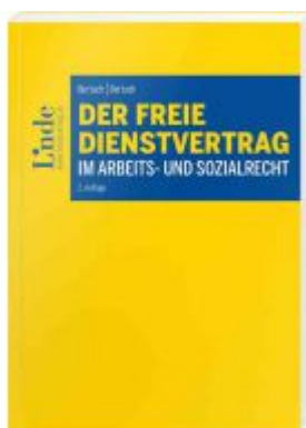
Der freie Dienstvertrag im Arbeits- und Sozialrecht Ladenpreis: 54,00 EUR