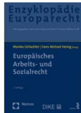
Europäisches Arbeits- und Sozialrecht Ladenpreis: 193,30 EUR