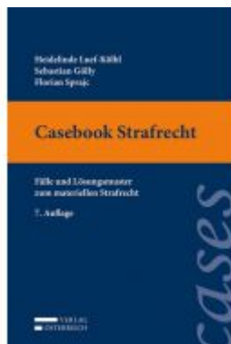
Casebook Strafrecht Ladenpreis: 36,00 EUR

Wir haben andere Produkte gefunden, die Ihnen gefallen könnten!