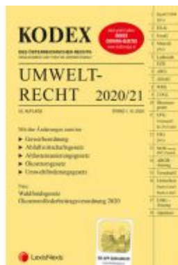
KODEX Umweltrecht 2020/21 Ladenpreis: 105,00 EUR