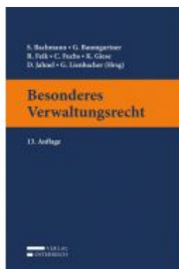
Besonderes Verwaltungsrecht Ladenpreis: 55,00 EUR