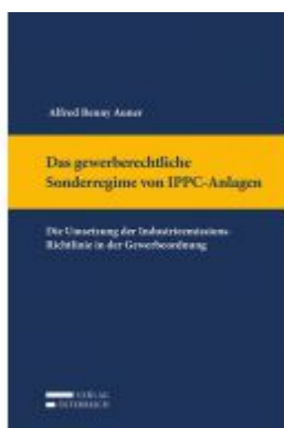
Das gewerberechtliche Sonderregime von IPPC-Anlagen Ladenpreis: 129,00 EUR