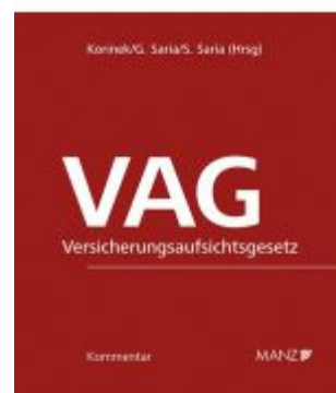
VAG - Versicherungsaufsichtsgesetz Ladenpreis: 328,00 EUR