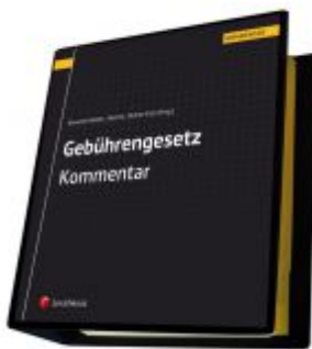
Gebührengesetz Kommentar Ladenpreis: 198,00 EUR