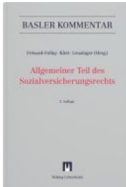
Allgemeiner Teil des Sozialversicherungsrechts Ladenpreis: 416,00EUR