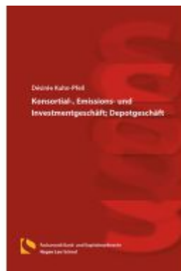
Konsortial-, Emissions- und Investmentgeschäft; Depotgeschäft Ladenpreis: 36,00EUR