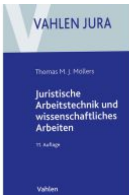
Juristische Arbeitstechnik und wissenschaftliches Arbeiten Ladenpreis: 25,60EUR