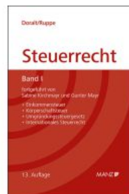
Grundriss des österreichischen Steuerrechts Ladenpreis: 79,00EUR