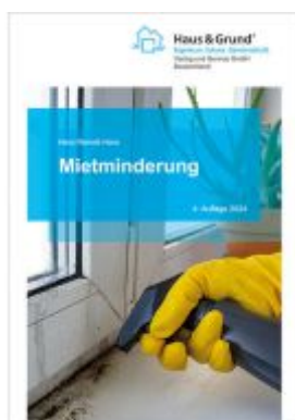
Mietminderung Ladenpreis: 20,60EUR