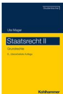
Staatsrecht II Ladenpreis: 38,00EUR