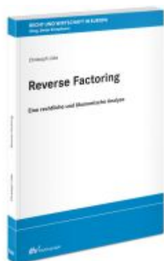
Reverse Factoring Ladenpreis: 91,50EUR