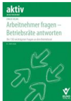
Arbeiter fragen – Betriebsräte antworten Ladenpreis: 47,30EUR