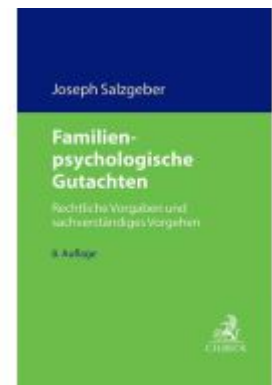
Familienpsychologische Gutachten Ladenpreis: 118,30EUR