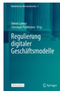
Regulierung digitaler Geschäftsmodelle Ladenpreis: 43,99EUR