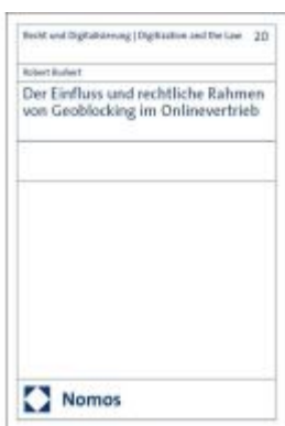
Der Einfluss und rechtliche Rahmen von Geoblocking im Onlinevertrieb Ladenpreis: 158,40EUR