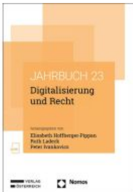
Digitalisierung und Recht Ladenpreis: 100,80EUR

Wir haben andere Produkte gefunden, die Ihnen gefallen könnten!