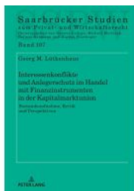
Interessenkonflikte und Anlegerschutz im Handel mit Finanzinstrumenten in der Kapitalmarktunion Ladenpreis: 56,50EUR