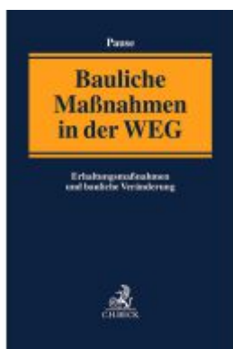
Bauliche Maßnahmen der Gemeinschaft der Wohnungseigentümer Ladenpreis: 204,60EUR