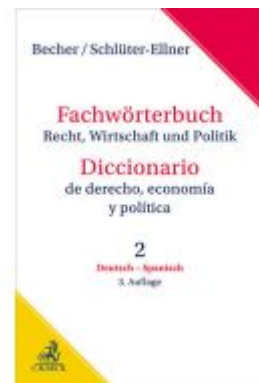
Fachwörterbuch Recht, Wirtschaft & Politik Band 2: Deutsch - Spanisch Ladenpreis: 204,60EUR