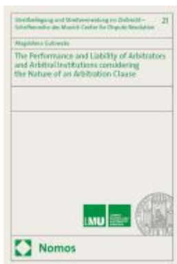
The Performance and Liability of Arbitrators and Arbitral Institutions considering the Nature of an Arbitration Clause Ladenpreis: 132,70EUR