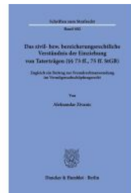
Das zivil- bzw. bereicherungsrechtliche Verständnis der Einziehung von Taterträgen (§§ 73 ff., 75 ff. StGB). Ladenpreis: 82,20EUR