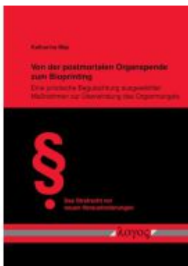
Von der postmortalen Organspende zum Bioprinting Ladenpreis: 55,00EUR

Wir haben andere Produkte gefunden, die Ihnen gefallen könnten!