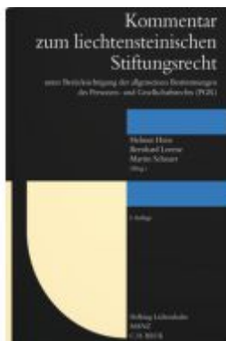
Kommentar zum liechtensteinischen Stiftungsrecht Ladenpreis: 348,00EUR