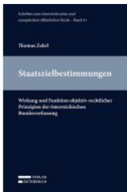
Staatszielbestimmungen Ladenpreis: 69,00EUR