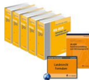
Heidelberger Kommentar zum Betreuungs- und Unterbringungsrecht Ladenpreis: 215,90EUR