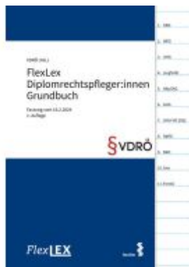
FlexLex Diplomrechtspfleger:innen Grundbuch Ladenpreis: 18,00EUR