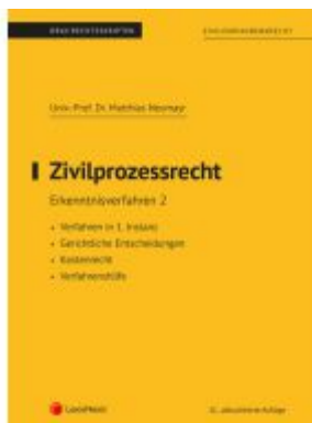
Zivilprozessrecht Erkenntnisverfahren 2 (Skriptum) Ladenpreis: 26,25EUR