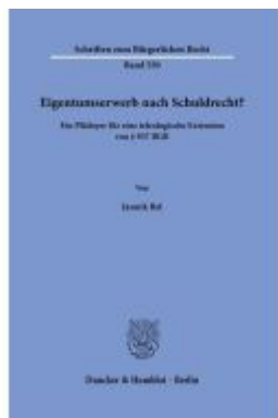
Eigentumserwerb nach Schuldrecht? Ladenpreis: 102,70EUR