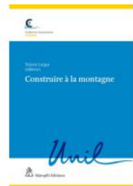
Construire à la montagne Ladenpreis: 93,00EUR