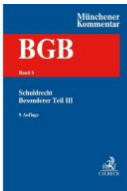
Münchener Kommentar zum Bürgerlichen Gesetzbuch Bd. 6: Schuldrecht - Besonderer Teil III §§ 631-704 Ladenpreis: 225,20EUR