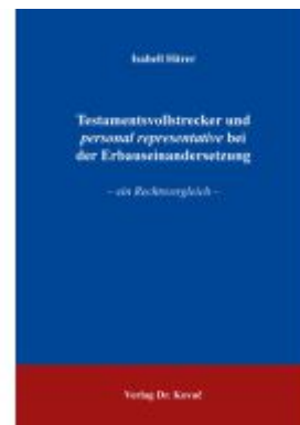
Testamentsvollstrecker und personal representative bei der Erbaueinandersetzung Ladenpreis: 91,40EUR