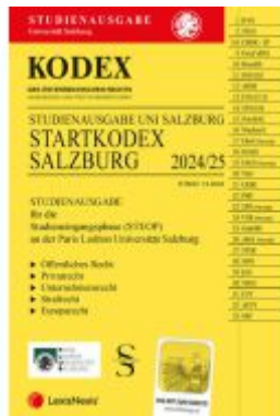
KODEX Startkodex Salzburg 2024/25 - inkl. App Ladenpreis: 21,00EUR