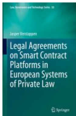
Legal Agreements on Smart Contract Platforms in European Systems of Private Law

Wir haben andere Produkte gefunden, die Ihnen gefallen könnten!