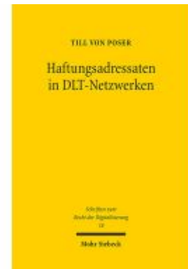
Haftungsadressaten in DLT-Netzwerken