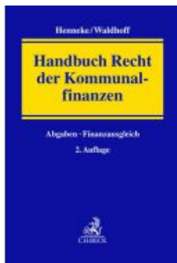
Handbuch Recht der Kommunal Finanzen