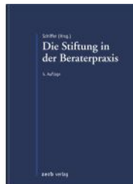
Die Stiftung in der Beraterpraxis