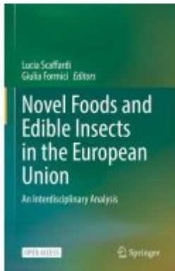
Novel Foods and Edible Insects in the European Union