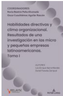
Habilidades directivas y clima organizacional. Resultados de una investigación en las micro y pequeñas empresas latinoamericanas