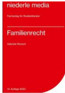
Familienrecht - 2023