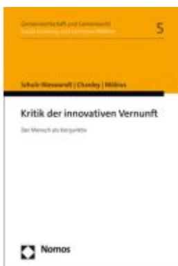
Kritik der innovativen Vernunft