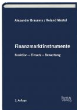
Finanzmarktinstrumente Ladenpreis: 35,00 EUR

Wir haben andere Produkte gefunden, die Ihnen gefallen könnten!