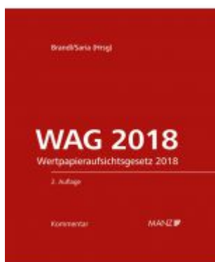
WAG 2018 2.Auflage Ladenpreis: 280,00 EUR