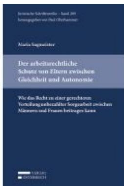
Der arbeitsrechtliche Schutz von Eltern zwischen Gleichheit und Autonomie Ladenpreis: 59,00 EUR