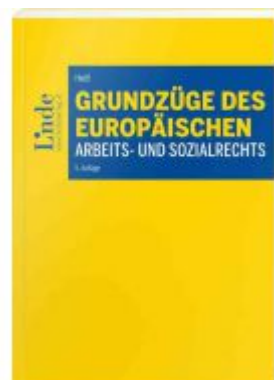
Grundzüge des europäischen Arbeits- und Sozialrechts Ladenpreis: 34,00 EUR