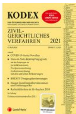
KODEX Zivilgerichtliches Verfahren 2021 Ladenpreis: 40,00 EUR