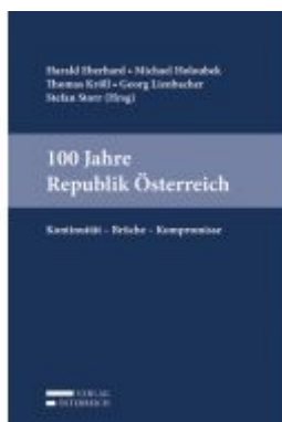
100 Jahre Republik Österreich Ladenpreis: 98,00 EUR