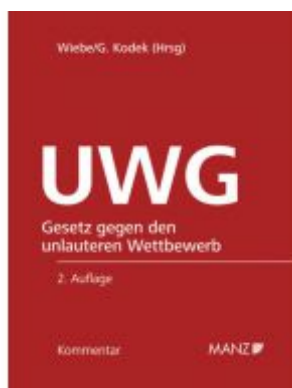
Kommentar zum UWG 2.Auflage Ladenpreis: 298,00 EUR