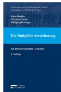
Die Haftpflichtversicherung Ladenpreis: 69,00 EUR