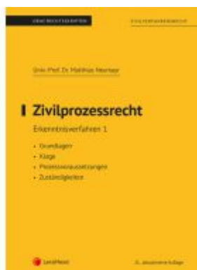
Zivilprozessrecht Erkenntnisverfahren 1 (Skriptum) Ladenpreis: 25,00EUR