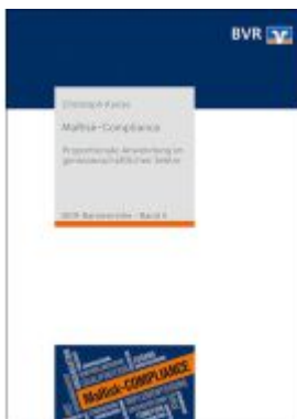
MaRisk-Compliance Ladenpreis: 15,80EUR

Wir haben andere Produkte gefunden, die Ihnen gefallen könnten!