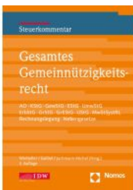
Gesamtes Gemeinnützigkeitsrecht, 3. Auflage Ladenpreis: 204,60EUR