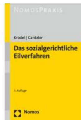
Das sozialgerichtliche Eilverfahren Ladenpreis: 40,10EUR