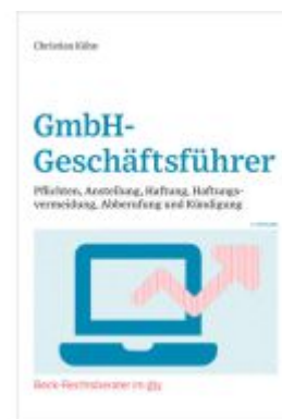
GmbH-Geschäftsführer Ladenpreis: 25,60EUR