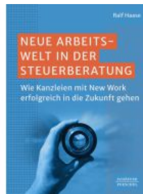
Neue Arbeitswelt in der Steuerberatung Ladenpreis: 41,20EUR