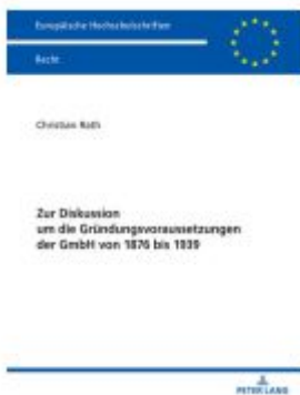
Zur Diskussion um die Gründungsvoraussetzungen der GmbH von 1876 bis 1939 Ladenpreis: 46,20EUR