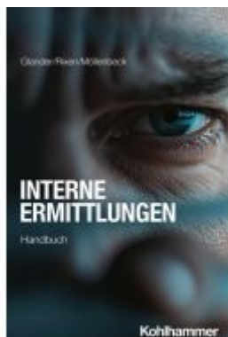
Interne Untersuchungen Ladenpreis: 40,10EUR