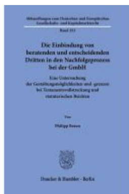
Die Einbindung von beratenden und entscheidenden Dritten in den Nachfolgeprozess bei der GmbH Ladenpreis: 92,50EUR