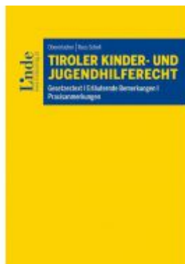
Tiroler Kinder- und Jugendhilferecht Ladenpreis: 39,00 EUR