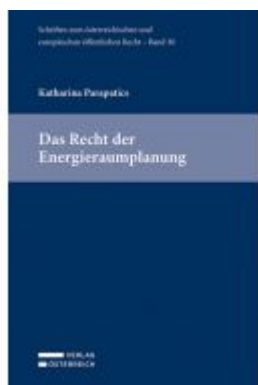
Das Recht der Energieräumplanung Ladenpreis: 109,00 EUR