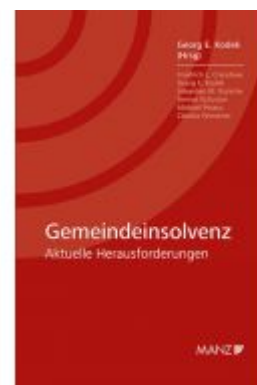
Gemeindeinsolvenz Ladenpreis: 54,00 EUR