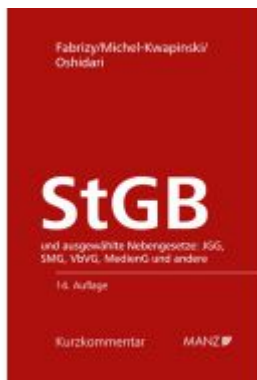
Strafgesetzbuch StGB Ladenpreis: 178,00 EUR

Wir haben andere Produkte gefunden, die Ihnen gefallen könnten!