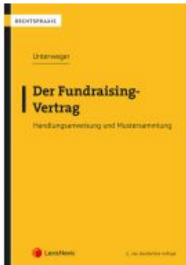
Der Fundraising-Vertrag Ladenpreis: 27,00 EUR