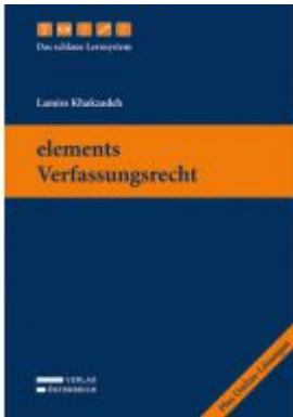
elements Verfassungsrecht Ladenpreis: 49,00 EUR