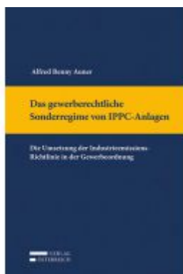
Das gewerberechtliche Sonderregime von IPPC-Anlagen Ladenpreis: 129,00 EUR