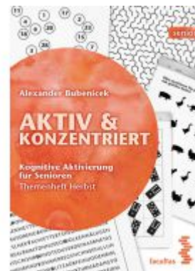
Aktiv & Konzentriert Ladenpreis: 17,90 EUR