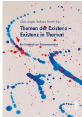
Themen der Existenz - Existenz in Themen Ladenpreis: 22,90 EUR