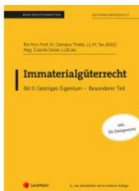
Immaterialgüterrecht (Skriptum) - Bd II Ladenpreis: 36,50EUR