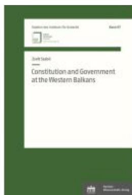
Constitution and Government at the Western Balkans Ladenpreis: 43,20EUR