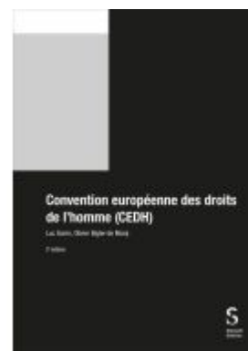
Convention européenne des droits de l'homme (CEDH) Ladenpreis: 346,80EUR