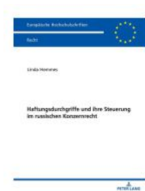
Haftungsdurchgriffe und ihre Steuerung im russischen Konzernrecht Ladenpreis: 63,70EUR