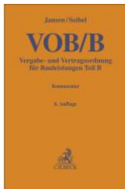
VOB/B Ladenpreis: 194,30EUR

Wir haben andere Produkte gefunden, die Ihnen gefallen könnten!