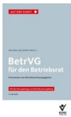
BetrVG für den Betriebsrat Ladenpreis: 50,40EUR