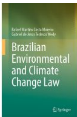
Brazilian Environmental and Climate Change Law Ladenpreis: 153,99EUR