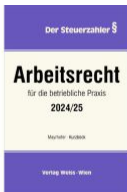
ARBEITSRECHT für die betriebliche Praxis 2024/25 Ladenpreis: 105,60EUR