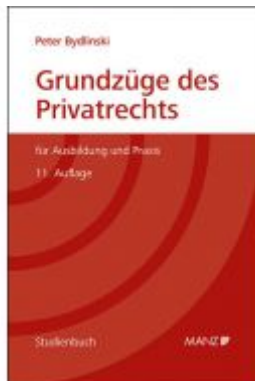
Grundzüge des Privatrechts Ladenpreis: 49,00 EUR