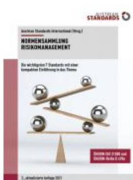
Normensammlung Risikomanagement Ladenpreis: 241,50 EUR