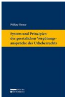
System und Prinzipien der gesetzlichen Vergütungsansprüche des Urheberrechts Ladenpreis: 129,00 EUR