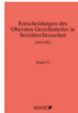
Entscheidungen des obersten Gerichtshofes in Sozialrechtssachen SSV-NF Ladenpreis: 139,20 EUR