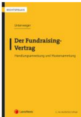
Der Fundraising-Vertrag Ladenpreis: 27,00 EUR