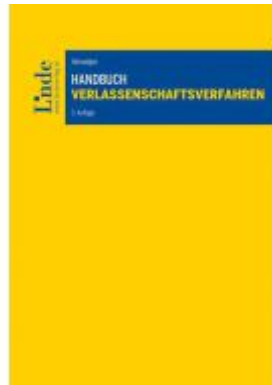
Handbuch Verlassenschaftsverfahren Ladenpreis: 95,00 EUR