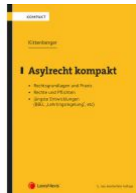
Asylrecht kompakt Ladenpreis: 34,00 EUR