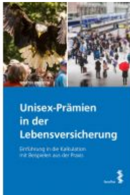
Unisex-Prämien in der Lebensversicherung Ladenpreis: 30,00 EUR