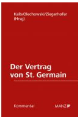
Der Vertrag von St. Germain Ladenpreis: 198,00 EUR