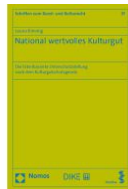
National wertvolles Kulturgut Ladenpreis: 139,90EUR