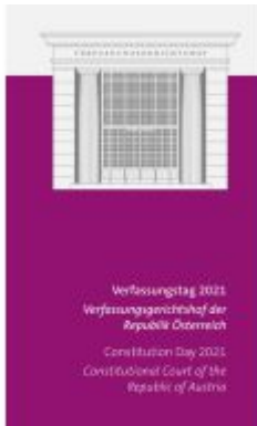
Verfassungstag 2021 Ladenpreis: 28,00EUR