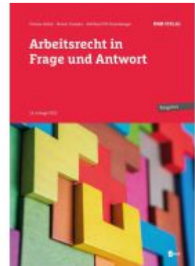
Arbeitsrecht in Frage und Antwort Ladenpreis: 39,00EUR