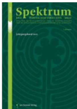
Spektrum des Wirtschaftsrechts Ladenpreis: 42,50EUR