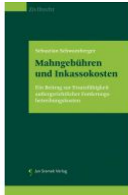
Mahngeld und Inkassokosten Ladenpreis: 59,90EUR