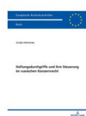
Haftungsdurchgriffe und ihre Steuerung im russischen Konzernrecht Ladenpreis: 63,70EUR