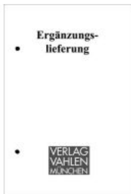
Betriebsrentenrecht (BetrAVG) Bd. 1: Arbeitsrecht 30. Ergänzungslieferung Ladenpreis: 64,80EUR