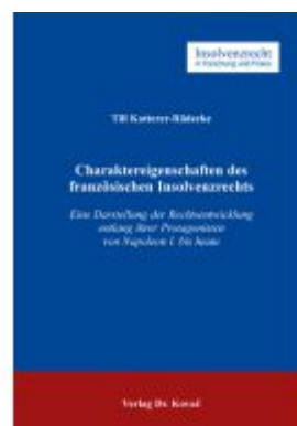
Charaktereigenschaften des französischen Insolvenzrechts Ladenpreis: 102,60EUR