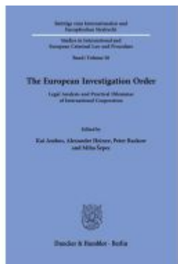
The European Investigation Order. Ladenpreis: 92,50EUR