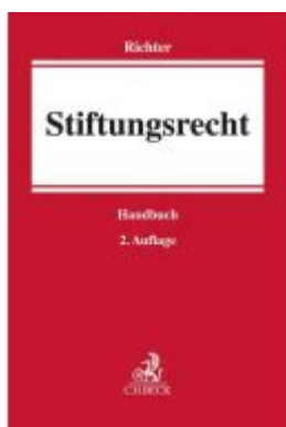
Stiftungsrecht Ladenpreis: 225,20EUR