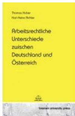
Arbeitsrechtliche Unterschiede zwischen Deutschland und Österreich Ladenpreis: 25,60EUR