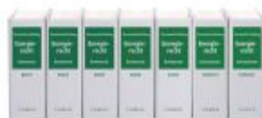
Energiericht Ladenpreis: 204,60EUR