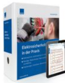
Elektrosicherheit in der Praxis