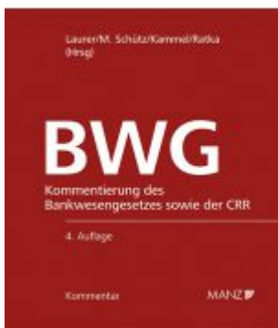
Bankwesengesetz - BWG 4.Auflage