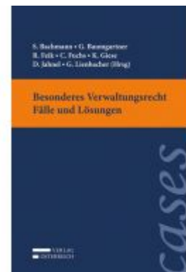
Besonderes Verwaltungsrecht - Fälle und Lösungen