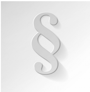
Die Haftung des Versicherungsmaklers