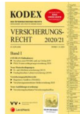
KODEX Versicherungsrecht Band I 2020/21