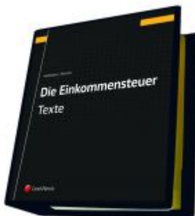
Die Einkommensteuer (ESTG 1988) Band I - Texte