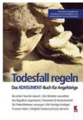
Todesfall regeln. Das KONSUMENT-Buch für Angehörige