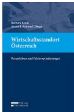
Wirtschaftsstandort Österreich Ladenpreis: 49,00EUR