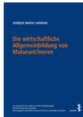
Die wirtschaftliche Allgemeinbildung von Maturant/inn/en Ladenpreis: 62,00EUR