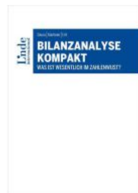
Bilanzanalyse kompakt Ladenpreis: 38,00EUR