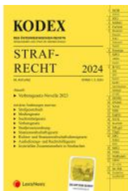
KODEX Strafrecht 2024 - inkl. App Ladenpreis: 40,00EUR