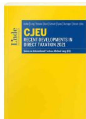
CJEU - Recent Developments in Direct Taxation 2021 Ladenpreis: 85,00EUR