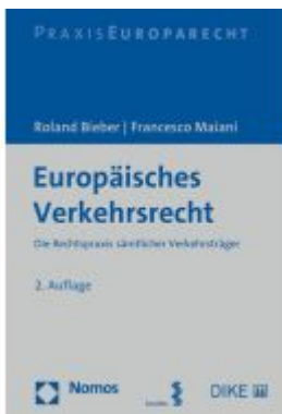
Europäisches Verkehrsrecht Ladenpreis: 91,50EUR