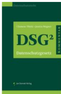
Praxiskommentar zum Datenschutzgesetz (DSG) Ladenpreis: 178,00EUR