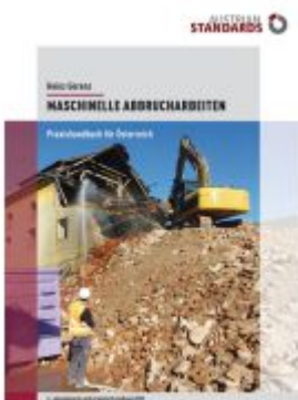
Maschinelle Abbrucharbeiten Ladenpreis: 75,90EUR