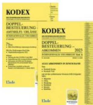
KODEX Doppelbesteuerung 2023 Ladenpreis: 71,00EUR