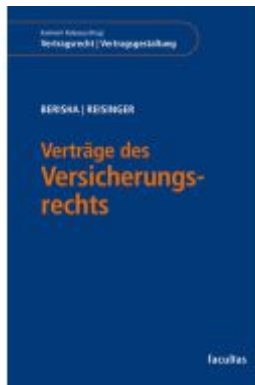
Verträge des Versicherungsrechts Ladenpreis: 58,00EUR