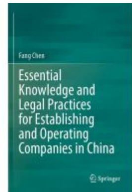
Essential Knowledge and Legal Practices for Establishing and Operating Companies in China