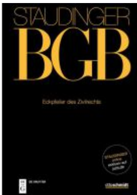
J. von Staudingers Kommentar zum Bürgerlichen Gesetzbuch mit Einführungsgesetz... / Eckpfeiler des Zivilrechts