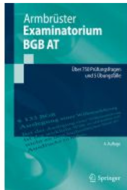
Examinatorium BGB AT Ladenpreis: 30,83EUR