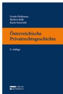
Österreichische Privatrechtsgeschichte Ladenpreis: 56,00EUR