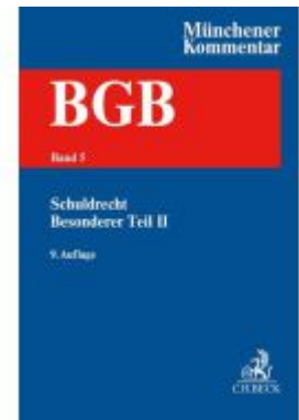
Münchener Kommentar zum Bürgerlichen Gesetzbuch Bd. 5: Schuldrecht - Besonderer Teil II §§ 535-630h, BetrKV, HeizkostenV, WärmelV, EFZG, TzBfG, KSchG, MiLoG Ladenpreis: 333,10EUR