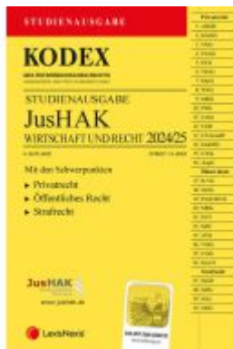
KODEX JusHAK 2024 - inkl. App