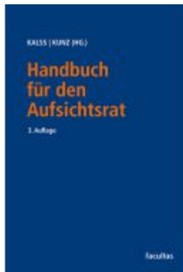
Handbuch für den Aufsichtsrat Ladenpreis: 280,00EUR