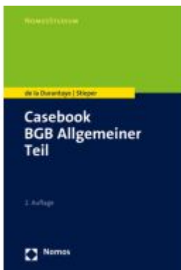
Casebook BGB Allgemeiner Teil Ladenpreis: 26,70EUR