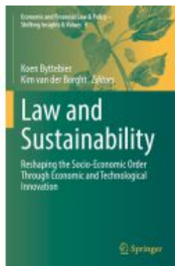
Law and Sustainability Ladenpreis: 175,99EUR