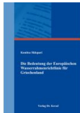
Die Bedeutung der Europäischen Wasserrahmenrichtlinie für Griechenland Ladenpreis: 91,40EUR