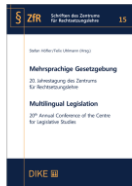
Mehrsprachige Gesetzgebung - Multilingual Legislation Ladenpreis: 46,00EUR