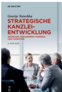
Strategische Kanzleientwicklung Ladenpreis: 59,95EUR