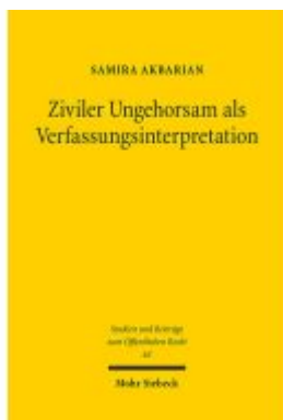
Ziviler Ungehorsam als Verfassungsinterpretation Ladenpreis: 86,40EUR