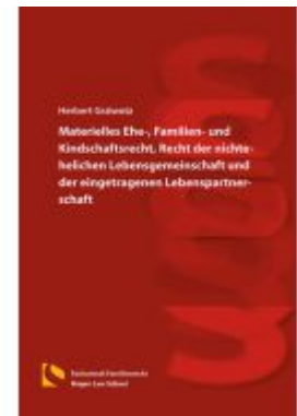
Materielles Ehe-, Familien- und Kindschaftsrecht, Recht der nichtehelichen Lebensgemeinschaft und der eingetragenen Lebenspartnerschaft Ladenpreis: 56,50EUR