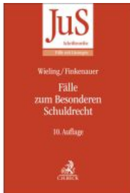
Fälle zum Besonderen Schuldrecht Ladenpreis: 30,70EUR