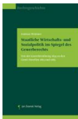
Staatliche Wirtschafts- und Sozialpolitik im Spiegel des Gewerberechts Ladenpreis: 49,90EUR