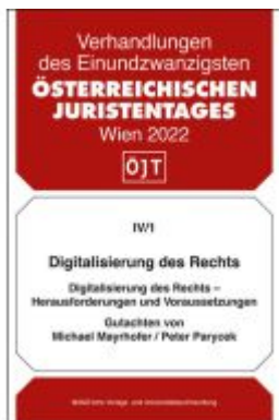
Digitalisierung des Rechts - Herausforderungen und Voraussetzungen Ladenpreis: 38,00EUR