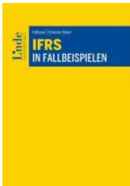
IFRS in Fallbeispielen Ladenpreis: 58,00EUR