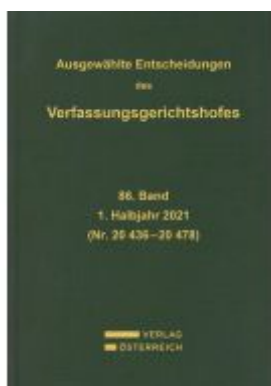
Ausgewählte Entscheidungen des Verfassungsgerichtshofes Ladenpreis: 419,00EUR