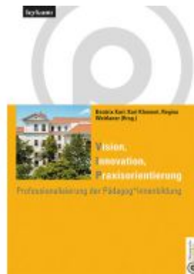
Vision Innovation Praxisorientierung Professionalisierung der Pädagog*innenbildung Ladenpreis: 35,00EUR