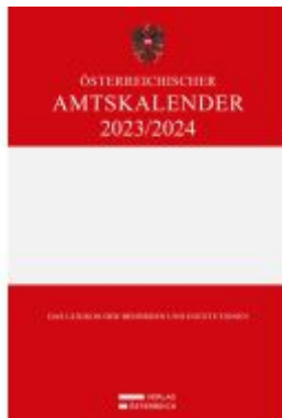
Österreichischer Amtskalender 2023/2024 Ladenpreis: 328,00EUR