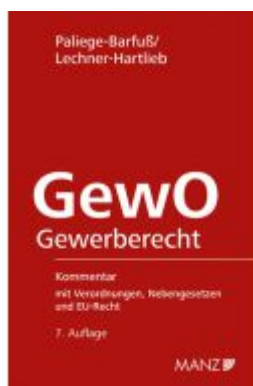
Gewerbeordnung Ladenpreis: 498,00EUR