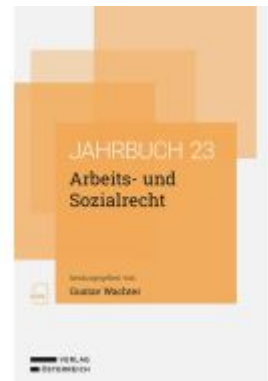
Arbeits- und Sozialrecht Ladenpreis: 74,00EUR