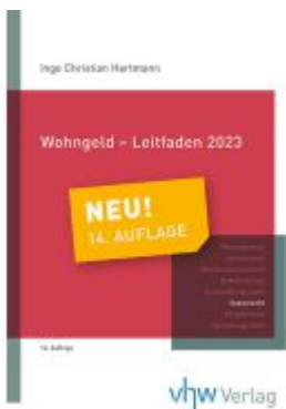
Wohngeld-Leitfaden 2023 Ladenpreis: 53,50EUR