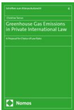
Greenhouse Gas Emissions in Private International Law Ladenpreis: 132,70EUR