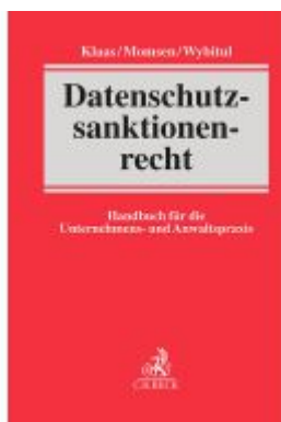
Datenschutzsanktionenrecht Ladenpreis: 163,50EUR