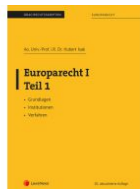
Europarecht I – Teil 1 (Skriptum) Ladenpreis: 30,00EUR