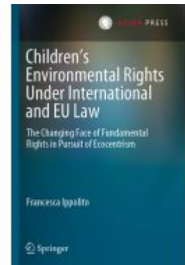
Children's Environmental Rights Under International and EU Law Ladenpreis: 153,99EUR