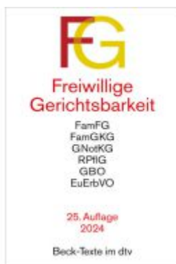
Freiwillige Gerichtsbarkeit Ladenpreis: 20,50EUR