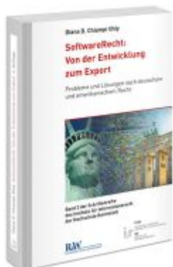
SoftwareRecht: Von der Entwicklung zum Export Ladenpreis: 32,90EUR

Wir haben andere Produkte gefunden, die Ihnen gefallen könnten!