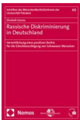
Rassische Diskriminierung in Deutschland Ladenpreis: 137,80EUR