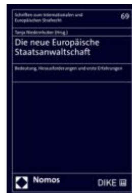
Die neue Europäische Staatsanwaltschaft Ladenpreis: 40,10EUR