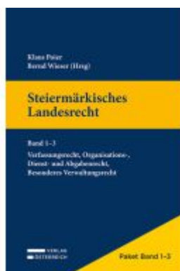
Paket Steiermärkisches Landesrecht: Band 1-3