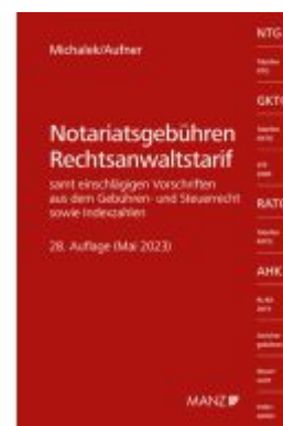
Notariatsgebühren - Rechtsanwaltstarif