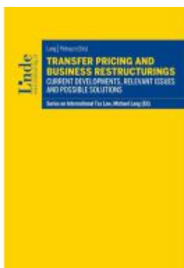
Transfer Pricing and Business Restructurings Ladenpreis: 45,00EUR