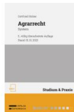
Agrarrecht Ladenpreis: 88,00EUR