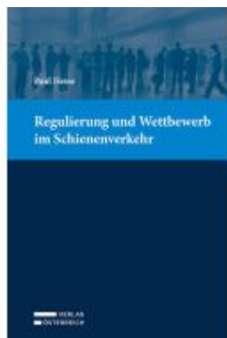
Regulierung und Wettbewerb im Schienenverkehr Ladenpreis: 74,00EUR