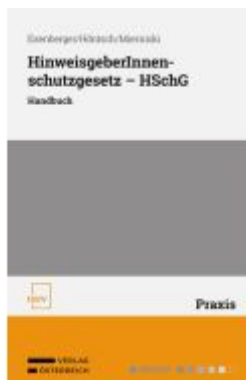
HinweisgeberInnen-schutzgesetz – HSchG Ladenpreis: 78,00EUR