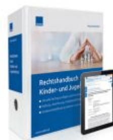
Rechtshandbuch Kinder- und Jugendschutz Ladenpreis: 239,80EUR