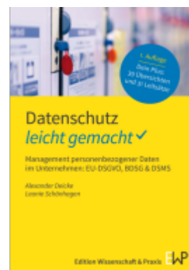
Datenschutz – leicht gemacht. Ladenpreis: 17,40EUR