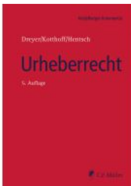
Urheberrecht Ladenpreis: 205,70EUR

Wir haben andere Produkte gefunden, die Ihnen gefallen könnten!