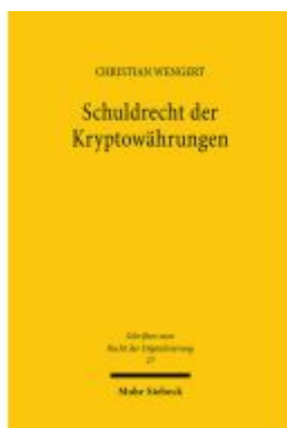
Schuldrecht der Kryptowährungen Ladenpreis: 96,70EUR