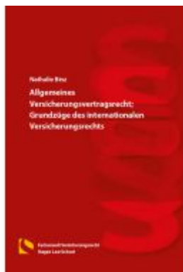
Allgemeines Versicherungsvertragsrecht; Grundzüge des internationalen Versicherungsrechts Ladenpreis: 46,30EUR