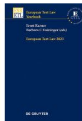
2023 Ladenpreis: 208,00EUR