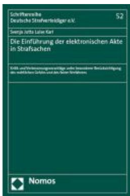
Die Einführung der elektronischen Akte in Strafsachen Ladenpreis: 158,40EUR