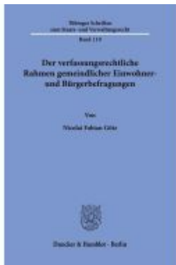
Der verfassungsrechtliche Rahmen gemeindlicher Einwohner- und Bürgerbefragungen. Ladenpreis: 71,90EUR