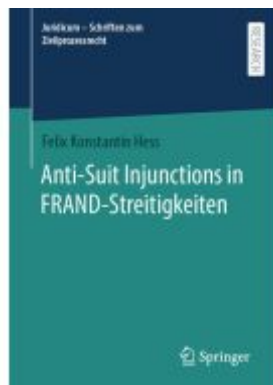
Anti-Suit Injunctions in FRAND-Streitigkeiten Ladenpreis: 92,51EUR