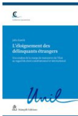
L'éloignement des délinquants étrangers Ladenpreis: 170,50EUR