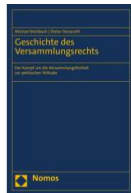
Geschichte des Versammlungsrechts Ladenpreis: 256,00EUR