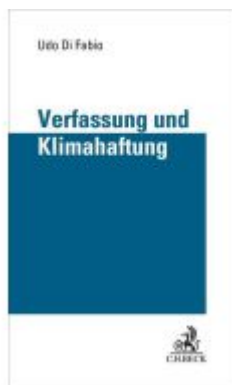
Verfassung und Klimahaftung Ladenpreis: 20,60EUR