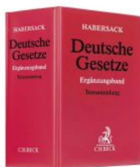
Deutsche Gesetze Ergänzungsband Ladenpreis: 29,90EUR