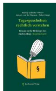
Tagesgeschehen rechtlich verstehen Ladenpreis: 14,90EUR