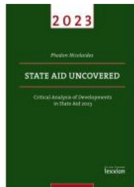
State Aid Uncovered Ladenpreis: 59,70EUR