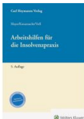
Arbeitshilfen für die Insolvenzpraxis Ladenpreis: 122,40EUR