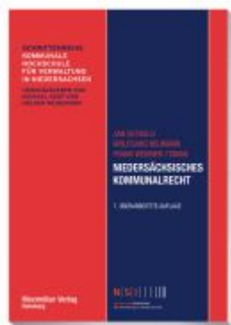
Niedersächsisches Kommunalrecht Ladenpreis: 30,80EUR