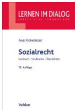
Sozialrecht Ladenpreis: 24,60EUR

Wir haben andere Produkte gefunden, die Ihnen gefallen könnten!