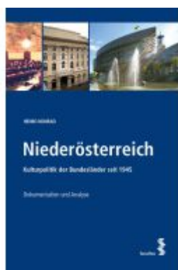
Niederösterreich Ladenpreis: 90,00EUR