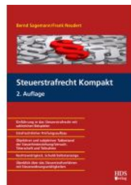
Steuerstrafrecht Kompakt Ladenpreis: 46,20EUR