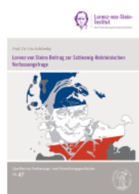
Lorenz von Steins Beitrag zur Schleswig-Holsteinischen Verfassungsfrage Ladenpreis: 15,40EUR