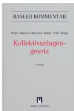
Kollektivanlagengesetz (KAG) Ladenpreis: 515,00EUR