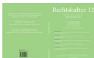
Rechtskultur 12 Ladenpreis: 49,50EUR