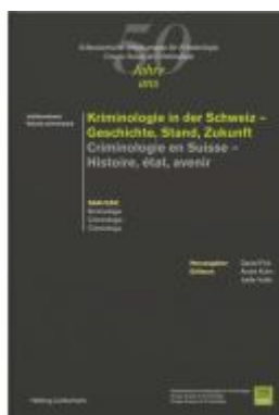
Kriminologie in der Schweiz - Geschichte, Stand, Zukunft - Criminologie en Suisse - Histoire, état, avenir Ladenpreis: 86,00EUR