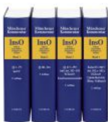
Münchener Kommentar zur Insolvenzordnung Gesamtwerk Ladenpreis: 1.003,40EUR