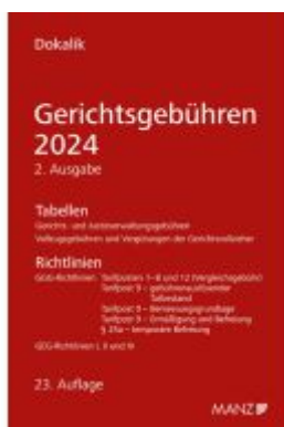
Gerichtsgebühren 2024 Tabellen und Richtlinien Ladenpreis: 46,00EUR