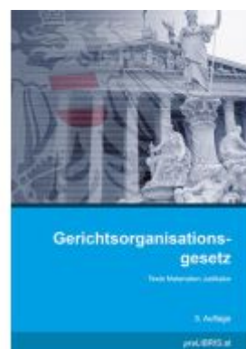
Gerichtsorganisationsgesetz Ladenpreis: 26,00EUR