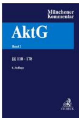
Münchener Kommentar zum Aktiengesetz Bd. 3: §§ 118-178 Ladenpreis: 353,70EUR