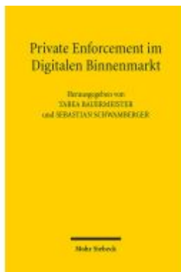
Private Enforcement im Digitalen Binnenmarkt Ladenpreis: 81,30EUR