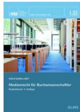
Medienrecht für Buchwissenschaftler Ladenpreis: 51,30EUR