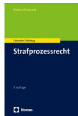
Strafprozessrecht Ladenpreis: 27,70EUR