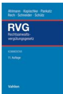
Rechtsanwaltsvergütungsgesetz Ladenpreis: 163,50EUR