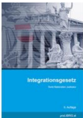
Integrationsgesetz Ladenpreis: 23,00EUR