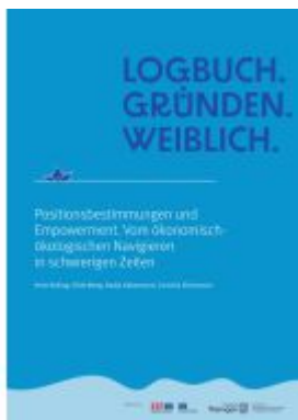
Logbuch. Gründen. Weiblich. Ladenpreis: 20,40EUR