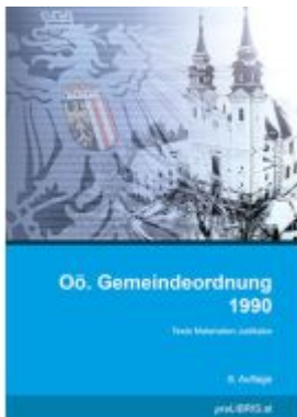
Oö. Gemeindeordnung 1990 Ladenpreis: 28,00EUR

Wir haben andere Produkte gefunden, die Ihnen gefallen könnten!