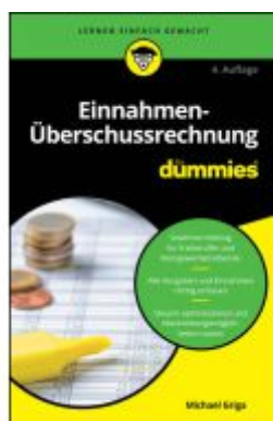
Einnahmen-Überschussrechnung für Dummies Ladenpreis: 15,50EUR