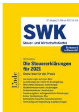
Die Steuererklärungen für 2021 Ladenpreis: 43,00EUR