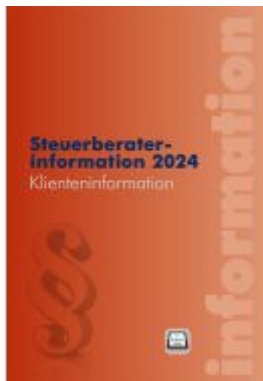
Steuerberaterinformation 2024 Ladenpreis: 52,00EUR