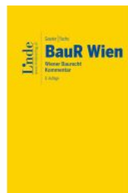
BauR Wien | Wiener Baurecht Ladenpreis: 120,00EUR