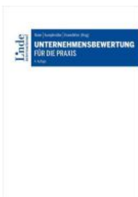
Unternehmensbewertung für die Praxis Ladenpreis: 109,00EUR