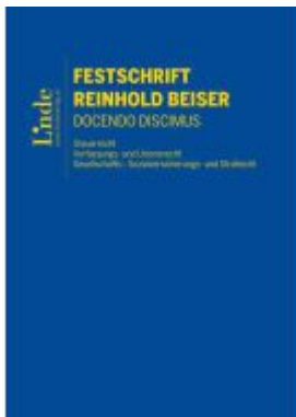
Festschrift Reinhold Beiser Ladenpreis: 160,00EUR

Wir haben andere Produkte gefunden, die Ihnen gefallen könnten!