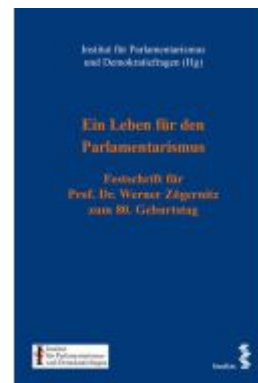
Ein Leben für den Parlamentarismus Ladenpreis: 160,00EUR