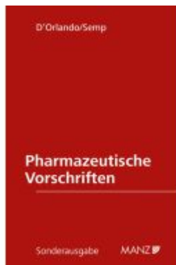
Pharmazeutische Vorschriften Ladenpreis: 248,00EUR