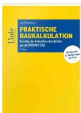
Praktische Baukalkulation Ladenpreis: 64,00EUR