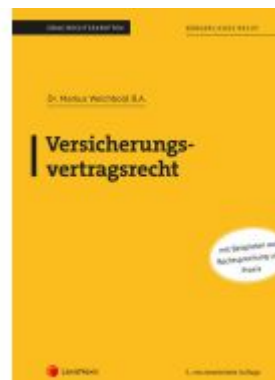
Versicherungsvertragsrecht (Skriptum) Ladenpreis: 30,00EUR