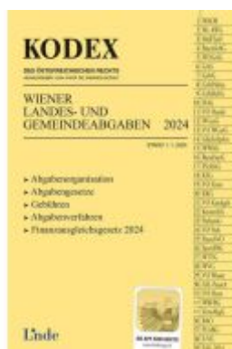
KODEX Wiener Landes- und Gemeindeabgaben Ladenpreis: 29,00EUR