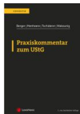
Praxiskommentar zum UStG Ladenpreis: 187,00EUR