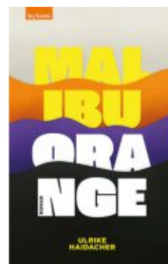
Malibu Orange Ladenpreis: 24,50EUR