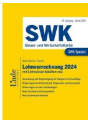
SWK-Spezial Lohnverrechnung 2024 Ladenpreis: 50,00EUR