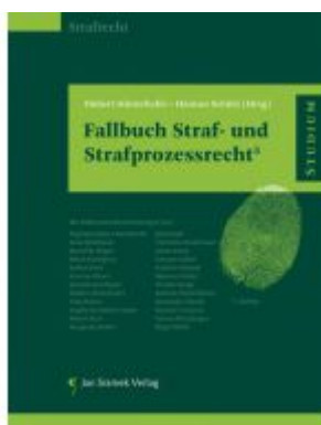
Fallbuch Straf- und Strafprozessrecht5 Ladenpreis: 44,90EUR