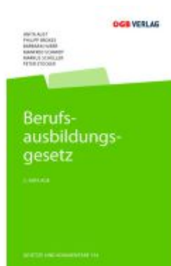
Berufsausbildungsgesetz Ladenpreis: 89,00EUR