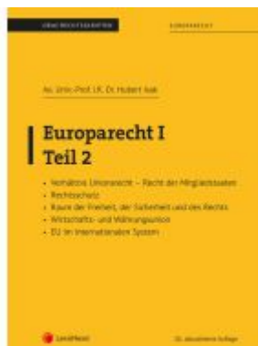
Europarecht I – Teil 2 Ladenpreis: 37,00EUR

Wir haben andere Produkte gefunden, die Ihnen gefallen könnten!