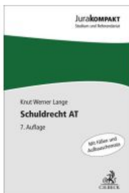
Schuldrecht AT Ladenpreis: 13,30EUR