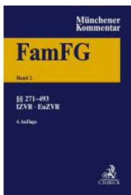
Münchener Kommentar zum FamFG Band 2: §§ 271-493, Internationales und Europäisches Zivilverfahrensrecht in Familiensachen Ladenpreis: 328,00EUR