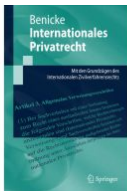
Internationales Privatrecht Ladenpreis: 25,65EUR