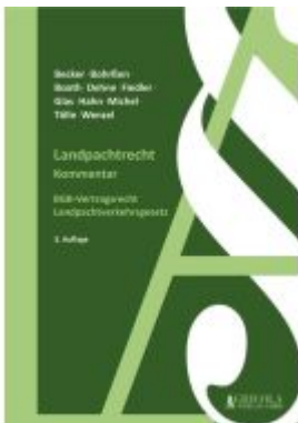
Landpachtrecht Ladenpreis: 104,90EUR

Wir haben andere Produkte gefunden, die Ihnen gefallen könnten!