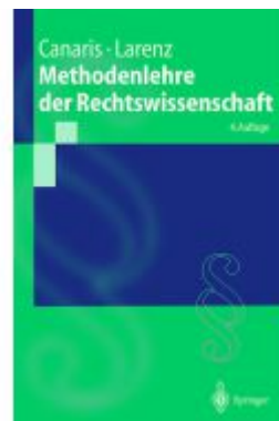
Methodenlehre der Rechtswissenschaft Ladenpreis: 25,65EUR