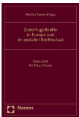
Zentrifugalkräfte in Europa und im sozialen Rechtsstaat Ladenpreis: 128,50EUR