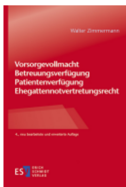
Vorsorgevollmacht – Betreuungsverfügung – Patientenverfügung – Ehegattennotvertretungsrecht Ladenpreis: 45,30EUR