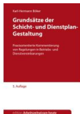
Grundsätze der Schicht- und Dienstplangestaltung Ladenpreis: 46,20EUR