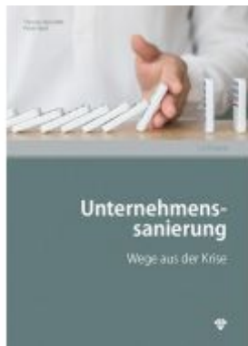
Unternehmenssanierung Ladenpreis: 31,90EUR