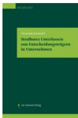
Strafbares Unterlassen von Entscheidungsträgern in Unternehmen Ladenpreis: 74,00EUR