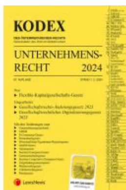
KODEX Unternehmensrecht 2024 - inkl. App Ladenpreis: 42,50EUR