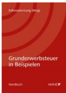
Grunderwerbsteuer in Beispielen Ladenpreis: 58,00EUR