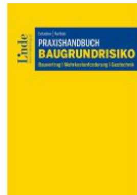
Praxishandbuch Baugrundrisiko Ladenpreis: 44,00EUR