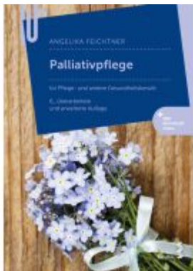
Palliativpflege Ladenpreis: 38,90EUR

Wir haben andere Produkte gefunden, die Ihnen gefallen könnten!