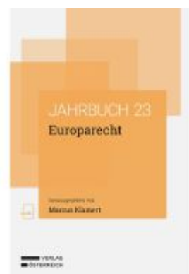
Europarecht Ladenpreis: 78,00EUR