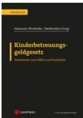
Kinderbetreuungsgeldgesetz Ladenpreis: 82,00EUR