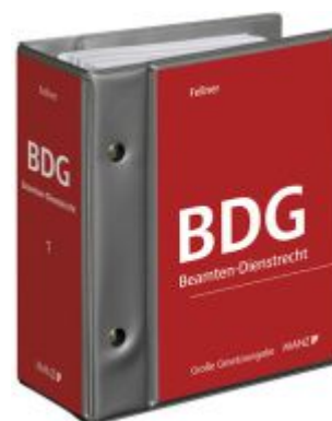
Beamten-Dienstrechtsgesetz Ladenpreis: 375,00EUR