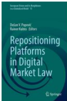
Repositioning Platforms in Digital Market Law Ladenpreis: 175,99EUR