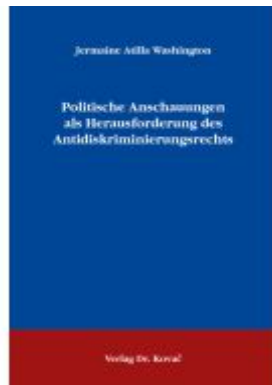
Politische Anschauungen als Herausforderung des Antidiskriminierungsrechts Ladenpreis: 101,60EUR