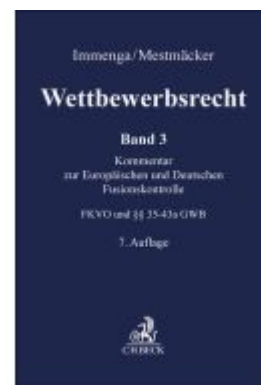
Wettbewerbsrecht Band 3: Fusionskontrolle. Kommentar zum Europäischen und Deutschen Kartellrecht Ladenpreis: 266,30EUR