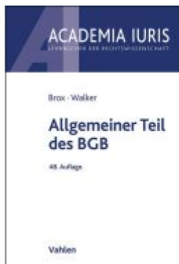
Allgemeiner Teil des BGB Ladenpreis: 26,70EUR