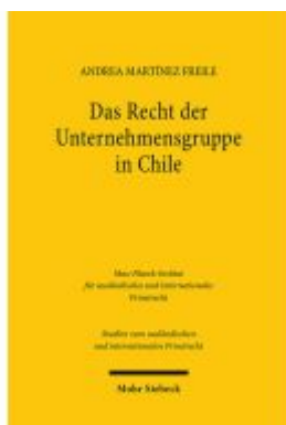
Das Recht der Unternehmensgruppe in Chile Ladenpreis: 82,30EUR