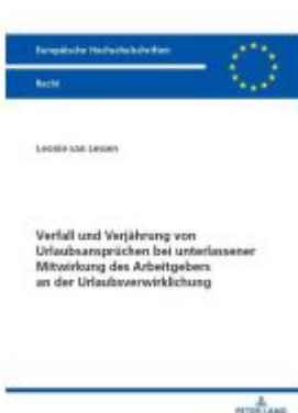
Verfall und Verjährung von Urlaubsansprüchen bei unterlassener Mitwirkung des Arbeitgebers an der Urlaubsverwirklichung Ladenpreis: 71,90EUR