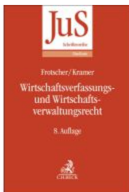
Wirtschaftsverfassungs- und Wirtschaftsverwaltungsrecht Ladenpreis: 46,20EUR