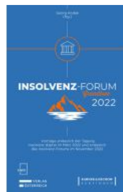
Insolvenz-Forum 2022 Ladenpreis: 78,00EUR