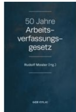
50 Jahre Arbeitsverfassungsgesetz Ladenpreis: 79,00EUR