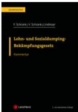
Lohn- und Sozialdumping-Bekämpfungsgesetz LSD-BG Ladenpreis: 148,00EUR