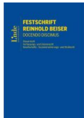
Festschrift Reinhold Beiser Ladenpreis: 160,00EUR