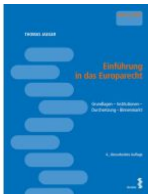
Einführung in das Europarecht Ladenpreis: 27,00EUR

Wir haben andere Produkte gefunden, die Ihnen gefallen könnten!