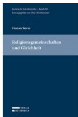
Religionsgemeinschaften und Gleichheit Ladenpreis: 145,00EUR