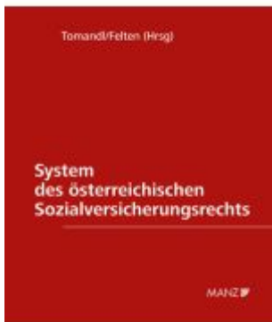
System des österreichischen Sozialversicherungsrechts Ladenpreis: 258,00EUR