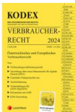
KODEX Verbraucherrecht 2024 Ladenpreis: 45,00EUR