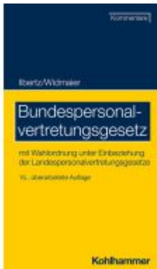
Bundespersönlichkeitsvertretungsgesetz Ladenpreis: 277,00EUR