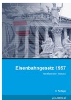
Eisenbahngesetz 1957 Ladenpreis: 38,00EUR