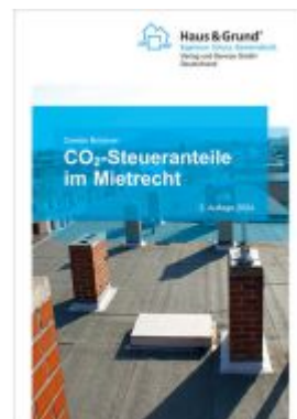
CO2-Steueranteile im Mietrecht Ladenpreis: 13,40EUR