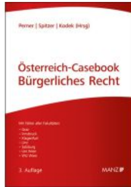
Österreich-Casebook Bürgerliches Recht Ladenpreis: 67,20EUR