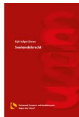
Seehandelsrecht Ladenpreis: 25,70EUR