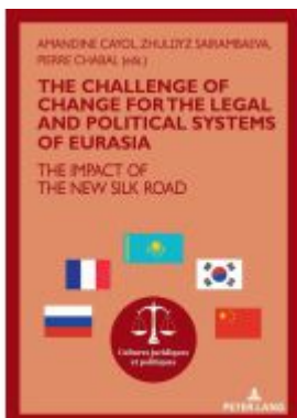
The challenge of change for the legal and political systems of Eurasia Ladenpreis: 119,15EUR

Wir haben andere Produkte gefunden, die Ihnen gefallen könnten!