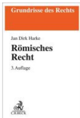
Römisches Recht Ladenpreis: 29,80EUR