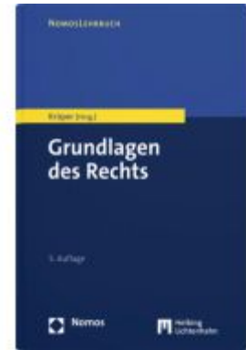
Grundlagen des Rechts Ladenpreis: 26,00EUR