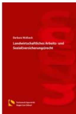
Landwirtschaftliches Arbeits- und Sozial(versicherungs)recht Ladenpreis: 19,50EUR