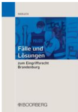
Fälle und Lösungen zum Eingriffsrecht Brandenburg Ladenpreis: 35,80EUR