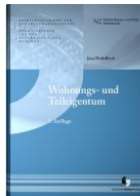
Wohnungs- und Teileigentum Ladenpreis: 25,60EUR