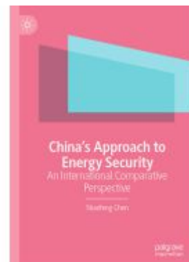
China's Approach to Energy Security Ladenpreis: 131,99EUR