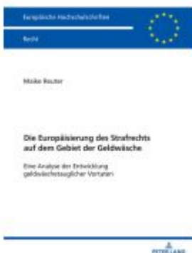
Die Europäisierung des Strafrechts auf dem Gebiet der Geldwäsche Ladenpreis: 51,40EUR