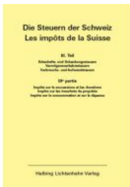
Die Steuern der Schweiz: Teil III EL 144 Ladenpreis: 75,00EUR

Wir haben andere Produkte gefunden, die Ihnen gefallen könnten!