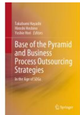
Base of the Pyramid and Business Process Outsourcing Strategies Ladenpreis: 175,99EUR