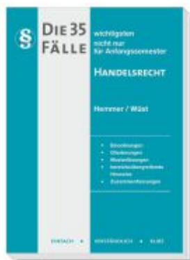
Die 35 wichtigsten Fälle Handelsrecht Ladenpreis: 16,40EUR