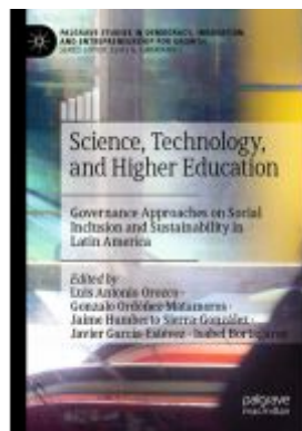
Science, Technology, and Higher Education Ladenpreis: 164,99EUR