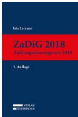
ZaDiG 2018 Ladenpreis: 159,00EUR