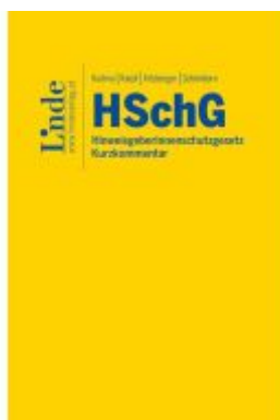
HSchG I HinweisgeberInnenschutzgesetz Ladenpreis: 55,00EUR