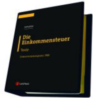
Die Einkommensteuer (EStG 1988) Band I - Texte Ladenpreis: 298,00EUR