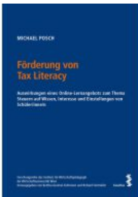
Förderung von Tax Literacy Ladenpreis: 63,00EUR