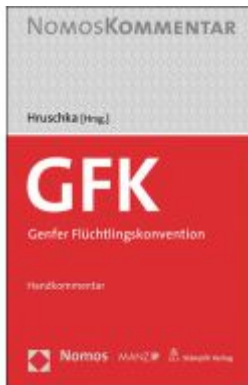
Genfer Flüchtlingskonvention Ladenpreis: 128,00EUR