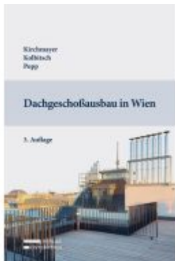
Dachgeschoßausbau in Wien Ladenpreis: 79,00EUR

Wir haben andere Produkte gefunden, die Ihnen gefallen könnten!