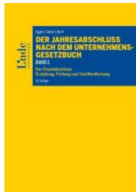
Der Jahresabschluss nach dem Unternehmensgesetzbuch, Band 1 Ladenpreis: 78,00EUR