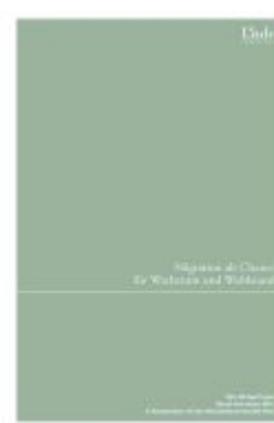
Migration als Chance für Wachstum und Wohlstand Ladenpreis: 48,00EUR