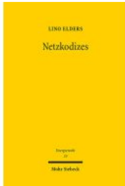
Netzkodizes Ladenpreis: 86,40EUR