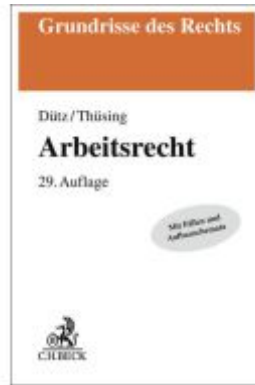
Arbeitsrecht Ladenpreis: 35,90EUR