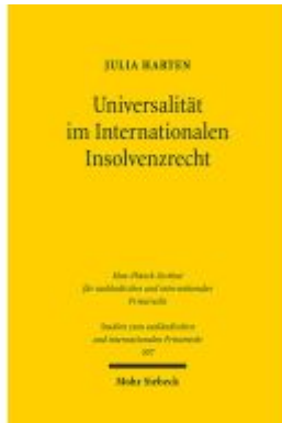
Universalität im Internationalen Insolvenzrecht Ladenpreis: 96,70EUR