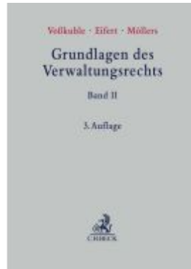
Grundlagen des Verwaltungsrechts Band II Ladenpreis: 256,50EUR