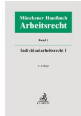
Münchener Handbuch zum Arbeitsrecht Bd. 1: Individualarbeitsrecht I Ladenpreis: 225,20EUR