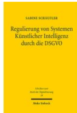
Regulierung von Systemen Künstlicher Intelligenz durch die DSGVO Ladenpreis: 112,10EUR