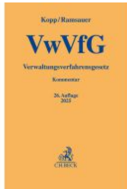
Verwaltungsverfahrensgesetz Ladenpreis: 77,10EUR