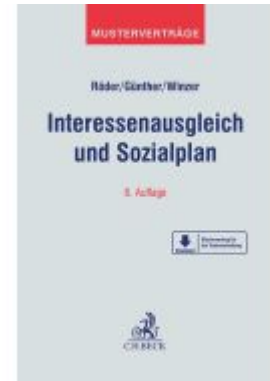
Interessenausgleich und Sozialplan Ladenpreis: 71,00EUR