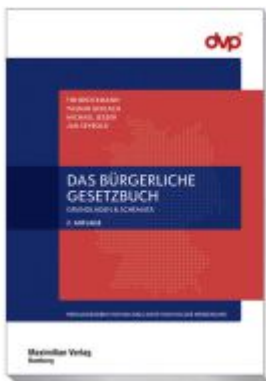
Das Bürgerliche Gesetzbuch Ladenpreis: 30,80EUR