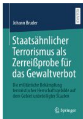
Staatsähnlicher Terrorismus als ZerreiBprobe für das Gewaltverbot Ladenpreis: 113,07EUR