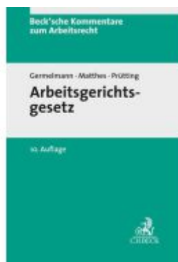
Arbeitsgerichtsgesetz Ladenpreis: 173,80EUR