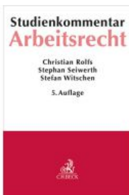
Arbeitsrecht Ladenpreis: 46,20EUR