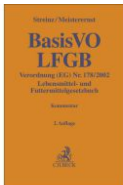
BasisVO / LFGB Ladenpreis: 204,60EUR

Wir haben andere Produkte gefunden, die Ihnen gefallen könnten!