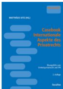
Casebook Internationale Aspekte des Privatrechts Ladenpreis: 29,00EUR