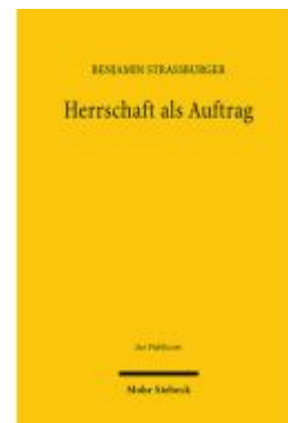
Herrschaft als Auftrag Ladenpreis: 122,40EUR