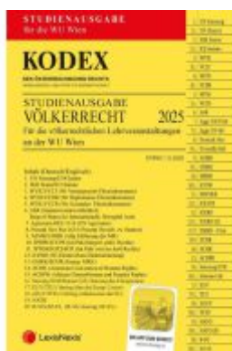
KODEX Völkerrecht Studienausgabe WU Wien Ladenpreis: 12,00EUR