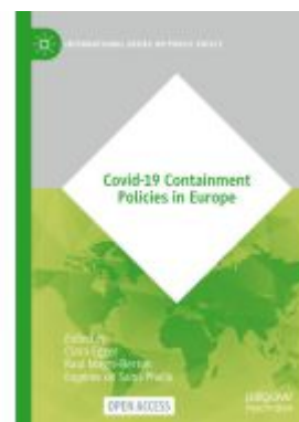
Covid-19 Containment Policies in Europe Ladenpreis: 43,99EUR