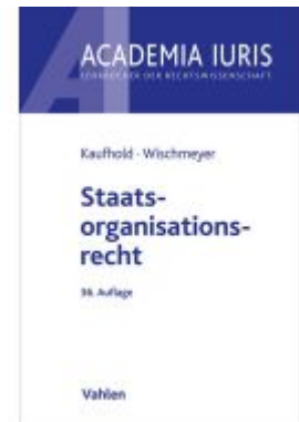
Staatsorganisationsrecht Ladenpreis: 26,70EUR