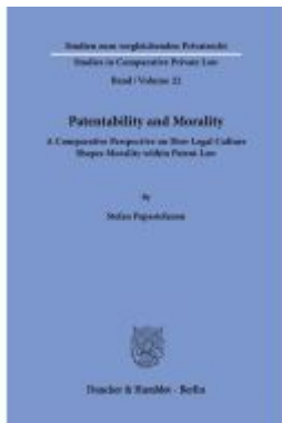
Patentability and Morality. Ladenpreis: 82,20EUR