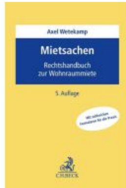
Mietsachen Ladenpreis: 81,30EUR