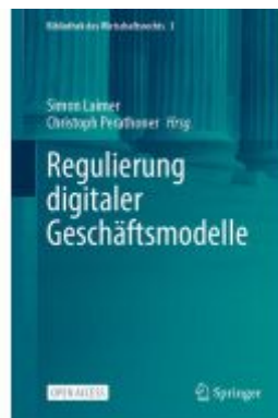
Regulierung digitaler Geschäftsmodelle Ladenpreis: 43,99EUR