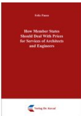
How Member States Should Deal With Prices for Services of Architects and Engineers Ladenpreis: 80,00EUR