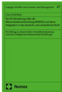
Die EU-Verordnung über die Wasserwiederverwendung (WWVO) und deren Integration in das deutsche und schwedische Recht Ladenpreis: 204,60EUR