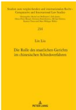
Die Rolle des staatlichen Gerichts im chinesischen Schiedsverfahren Ladenpreis: 71,90EUR