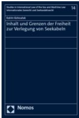
Inhalt und Grenzen der Freiheit zur Verlegung von Seekabeln Ladenpreis: 204,60EUR