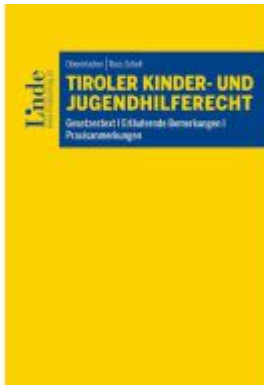
Tiroles Kinder- und Jugendhilferecht Ladenpreis: 39,00EUR