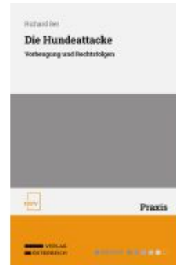
Die Hundeeatacke Ladenpreis: 48,00EUR