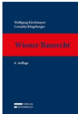
Wiener Baurecht Ladenpreis: 169,00EUR