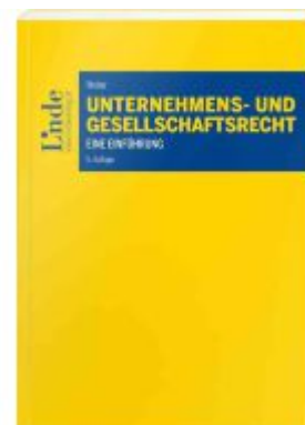
Unternehmens- und Gesellschaftsrecht Ladenpreis: 42,00EUR