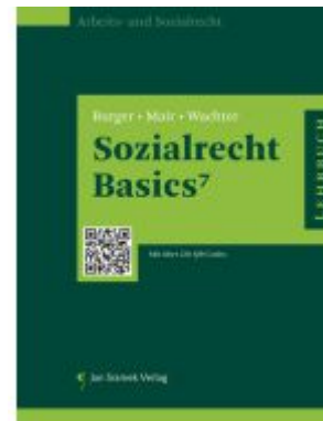
Sozialrecht Basics Ladenpreis: 39,90EUR