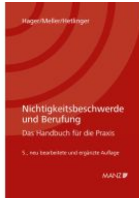
Nichtigkeitsbeschwerde und Berufung Ladenpreis: 79,00EUR