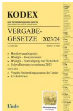
KODEX Vergabegesetze 2023/24 Ladenpreis: 55,00EUR