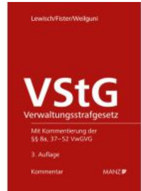
Verwaltungsstrafgesetz - VStG Ladenpreis: 138,00EUR