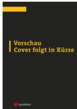
KFG Kraftfahrzeuggesetz - Taschenkommentar Ladenpreis: 139,00EUR