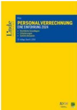
Personalverrechnung: eine Einführung 2024 Ladenpreis: 48,00EUR