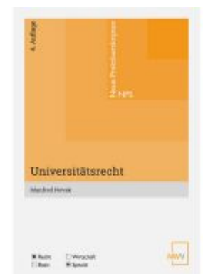
Universitätsrecht Ladenpreis: 26,00EUR