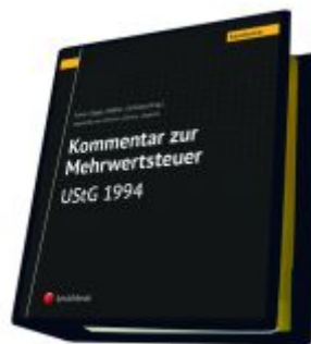
Kommentar zur Mehrwertsteuer - UStG 1994 Ladenpreis: 825,00EUR