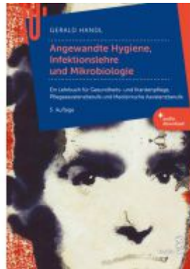
Angewandte Hygiene, Infektionslehre und Mikrobiologie Ladenpreis: 38,90EUR