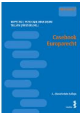
Casebook Europarecht Ladenpreis: 29,00EUR

Wir haben andere Produkte gefunden, die Ihnen gefallen könnten!