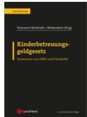
Kinderbetreuungsgeldgesetz Ladenpreis: 82,00EUR