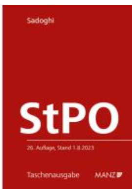
Strafprozessordnung StPO Ladenpreis: 24,80EUR