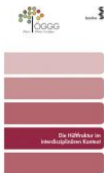
Die Hüftfraktur im interdisziplinären Kontext Ladenpreis: 5,70 EUR