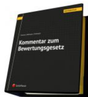
Kommentar zum Bewertungsgesetz Ladenpreis: 355,00 EUR