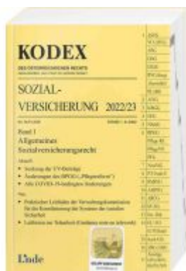
KODEX Sozialversicherung 2022/23, Band I Ladenpreis: 43,00 EUR