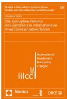
Die ‚Corruption Defence‘ des Gaststaats in internationalen Investitionsschiedsverfahren Ladenpreis: 80,20 EUR