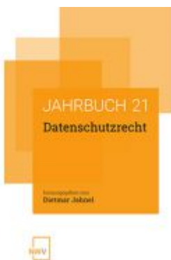
Datenschutzrecht Ladenpreis: 58,00 EUR