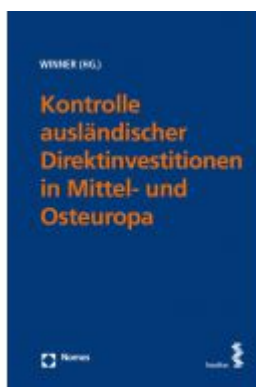
Kontrolle ausländischer Direktinvestitionen in Mittel- und Osteuropa Ladenpreis: 92,00 EUR