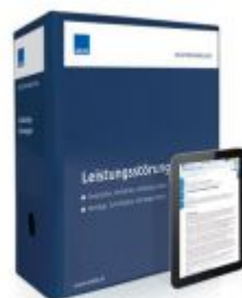
Mustersammlung Leistungsstörungen Ladenpreis: 250,80 EUR