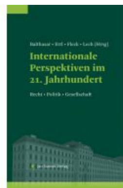
Internationale Perspektiven im 21. Jahrhundert Ladenpreis: 110,00 EUR