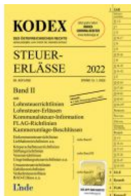
KODEX Steuer-Erlässe 2022, Band II Ladenpreis: 35,00 EUR