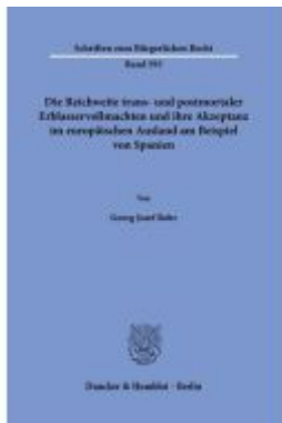
Die Reichweite trans- und postmortaler Erblasservollmachten und ihre Akzeptanz im europäischen Ausland am Beispiel von Spanien Ladenpreis: 82,20EUR