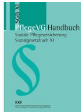
Pflege VG-Handbuch Ladenpreis: 57,10EUR