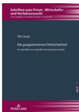
Die gruppeninterne Drittsicherheit Ladenpreis: 56,50EUR