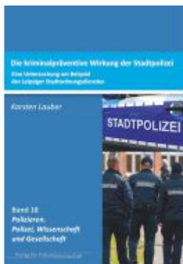
Kriminalpräventive Wirksamkeit der Stadtpolizei Ladenpreis: 33,90EUR