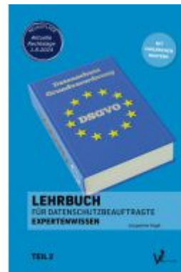
Lehrbuch für Datenschutzbeauftragte Ladenpreis: 30,80EUR