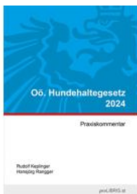
Oö. Hundehaltesgesetz 2024 Ladenpreis: 26,00EUR