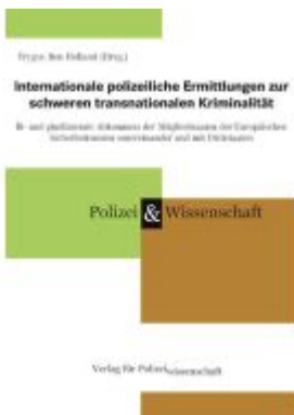
Internationale polizeiliche Ermittlungen zur schweren transnationalen Kriminalität Ladenpreis: 33,90EUR