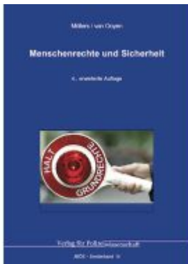
Menschenrechte und Sicherheit Ladenpreis: 41,10EUR