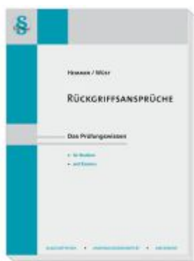
Rückgriffsansprüche Ladenpreis: 23,60EUR