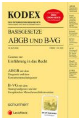
KODEX Basisgesetze ABGB und B-VG 2021/22 - inkl. App Ladenpreis: 15,00 EUR