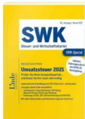
SWK-Spezial Umsatzsteuer 2021 Ladenpreis: 52,00 EUR