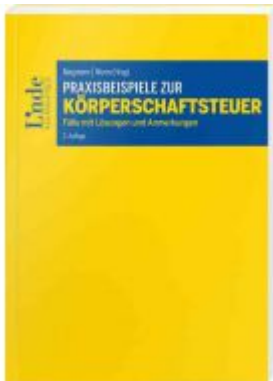
Praxisbeispiele zur Körperschaftsteuer Ladenpreis: 45,00 EUR