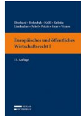
Europäisches und öffentliches Wirtschaftsrecht I Ladenpreis: 39,00 EUR