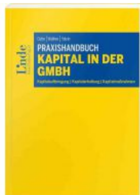
Praxishandbuch Kapital in der GmbH Ladenpreis: 55,00 EUR