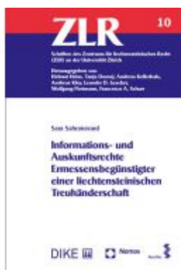
Informations- und Auskunftsrechte Ermessensbegünstigter einer liechtensteinischen Treuhänderschaft