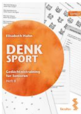
Denksport Ladenpreis: 14,90 EUR