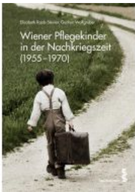
Wiener Pflegekinder in der Nachkriegszeit (1955-1970) Ladenpreis: 19,90 EUR

Wir haben andere Produkte gefunden, die Ihnen gefallen könnten!