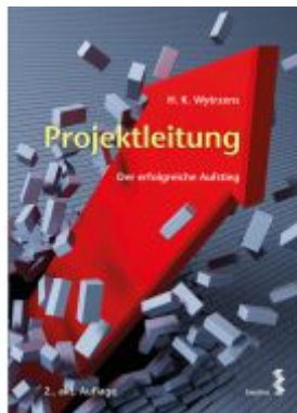
Projektleitung Ladenpreis: 34,90 EUR