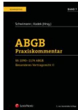
ABGB Praxiskommentar / ABGB Praxiskommentar - Band 7, 5. Auflage Ladenpreis: 249,00 EUR