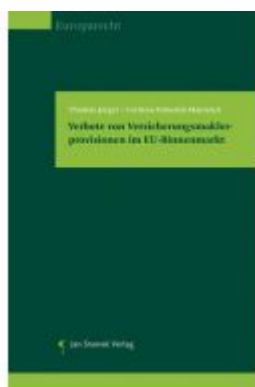
Verbote von Versicherungsmaklerprovisionen im EU- Binnenmarkt