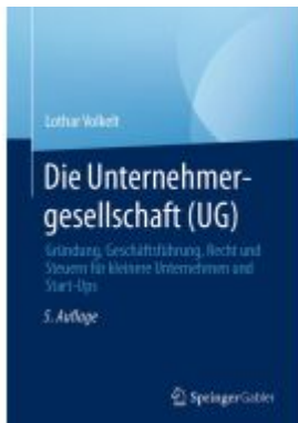
Die Unternehmergeellschaft (UG) Ladenpreis: 61,67EUR

Wir haben andere Produkte gefunden, die Ihnen gefallen könnten!