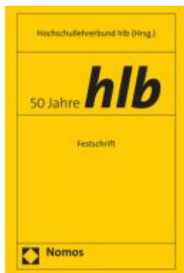
50 Jahre hlb Ladenpreis: 86,40EUR