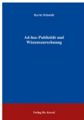
Ad-hoc-Publizität und Wissenszurechnung Ladenpreis: 102,60EUR