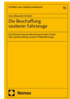
Die Beschaffung sauberer Fahrzeuge Ladenpreis: 81,30EUR