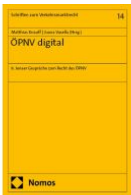
ÖPNV digital Ladenpreis: 35,00EUR