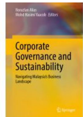
Corporate Governance and Sustainability Ladenpreis: 164,99EUR