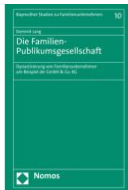
Die Familien-Publikumsgesellschaft Ladenpreis: 173,80EUR