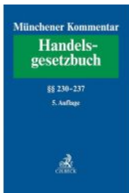
Münchener Kommentar zum Handelsgesetzbuch Band 3: Zweites Buch. Handelsgesellschaften und stille Gesellschaft. Dritter Abschnitt. Stille Gesellschaft §§ 230-237 Ladenpreis: 163,50EUR