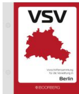
Vorschriftensammlung für die Verwaltung in Berlin (VSV) Ladenpreis: 71,00EUR