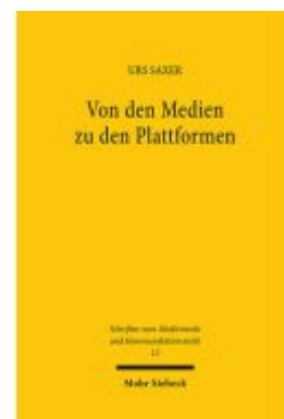
Von den Medien zu den Plattformen Ladenpreis: 60,70EUR