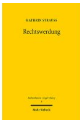
Rechtswerdung Ladenpreis: 81,30EUR