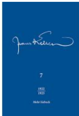
Hans Kelsen Werke Ladenpreis: 204,60EUR