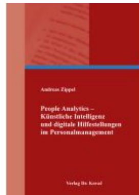
People Analytics – Künstliche Intelligenz und digitale Hilfestellungen im Personalmanagement Ladenpreis: 133,50EUR