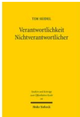
Verantwortlichkeit Nichtverantwortlicher Ladenpreis: 76,10EUR