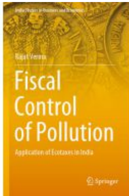
Fiscal Control of Pollution Ladenpreis: 131,99EUR