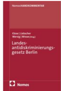
Landesantidiskriminierungsgesetz Berlin Ladenpreis: 81,30EUR