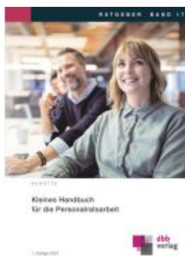
Kleines Handbuch für die Personalratsarbeit Ladenpreis: 20,50EUR