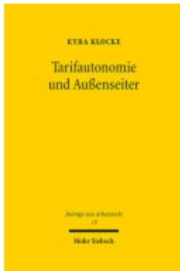
Tarifautonomie und Außenseiter Ladenpreis: 127,50EUR