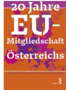
20 Jahre EU-Mitgliedschaft Österreichs Ladenpreis: 22,00 EUR