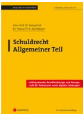
Schuldrecht Allgemeiner Teil (Skriptum) Ladenpreis: 18,00 EUR