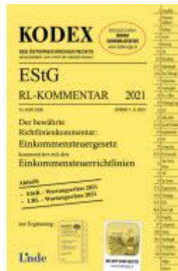
KODEX EStG Richtlinien-Kommentar 2021 Ladenpreis: 70,00 EUR