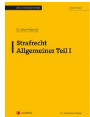
Strafrecht - Allgemeiner Teil I (Skriptum) Ladenpreis: 17,00 EUR