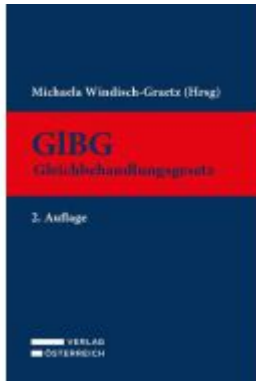
Gleichbehandlungsgesetz - GIBG Ladenpreis: 249,00 EUR