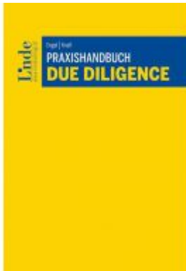
Praxishandbuch Due Diligence Ladenpreis: 68,00 EUR