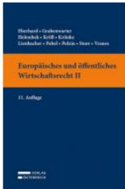
Europäisches und öffentliches Wirtschaftsrecht II Ladenpreis: 39,00 EUR