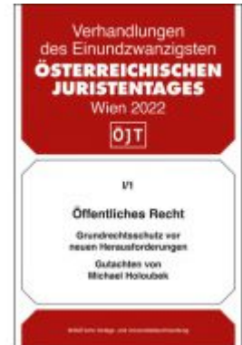
Öffentliches Recht Grundrechtsschutz vor neuen Herausforderungen Ladenpreis: 48,00 EUR