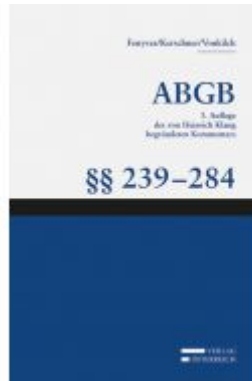
Großkommentar zum ABGB - Klang Kommentar Ladenpreis: 217,80 EUR